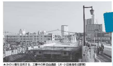
▲みのり債を活用する、工事中の新自由通店（JR・小田線海老名駅南側）