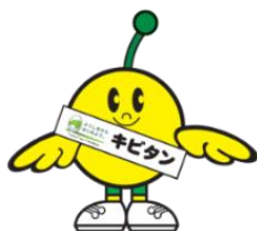
福島県復興シンボルキャラクター 「ふくしまから はじめよう。キビタン」