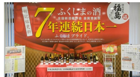
全国新酒鑑評会 金賞受賞数 7年連続日本一