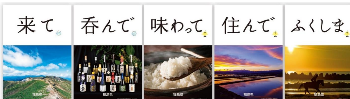
県公式イメージポスター