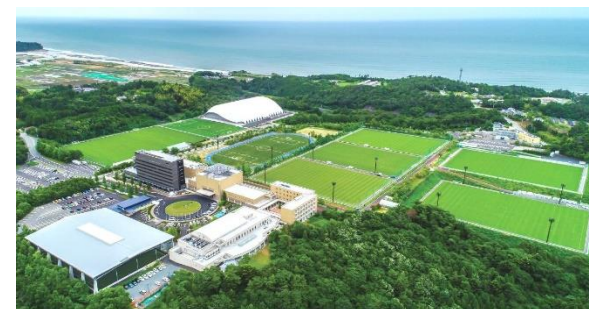
Jヴィレッジ (サッカー・ナショナルトレーニングセンター)