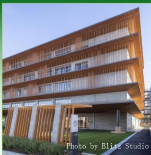
グリーンビルディングに関する事業